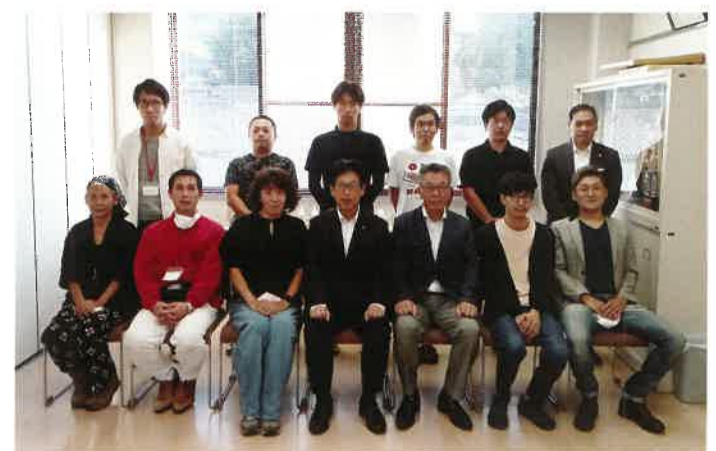
② 創業塾修了式記念写真

創業・起業・事業承継を考えている人、創業して間のない人に対し、創業・起業・経営にあたっての心構え、ビジネスプラン作成のポイント、税務・労務・販路・IT・金融など経営に必要な実践的内容について、「創業塾」を開催し、中小企業診断士、税理士、社会保険労務士、経営コンサルタント等による6日間の講義を行いました。今年は、13名の方が受講されました。