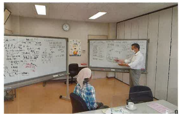
① 事業者に寄り添った伴走型支援

新型コロナウイルス感染症の影響から経営の維持を進めるにあたり、事業計画を策定・実施を進めることで、事業者の強みを活かした新たな商品・サービスの提供に繋がっています。