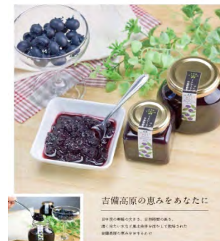
株式会社 吉備高原サツキ育英会