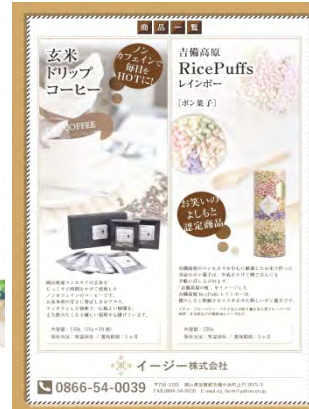
イージー株式会社