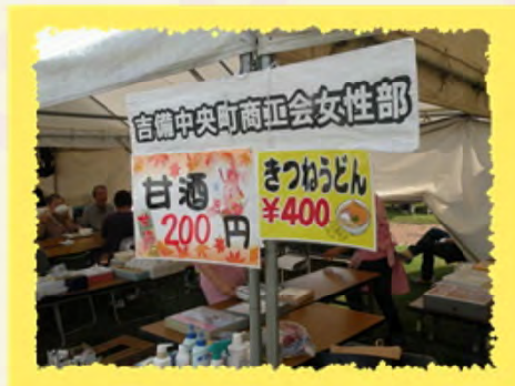
わっしょい和んさか吉備高原フェスタでうどんを販売!! 活動資金もバッチリ確保。