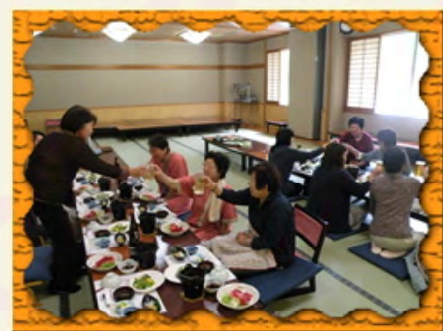
稲荷山健康ランドにて、総会後の楽しいお食事タイム。