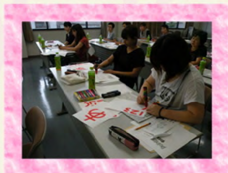
手書きポップの作り方を楽しくお勉強中。 販売上手になれたかな・・・。