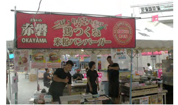
気合十分の赤磐青年部、おいしそうです!

記念すべき25回目の開催となった鬼伝祭で すが今回は2つ大きな事がありました。 まず日本有数の動画サイトニコニコ動画主催の イベント「町会議」の会場に選ばれたこと。 そして青年部同士の交流から生まれた縁で遙々 赤磐商工会から青年部員が参加して下さった ことです。