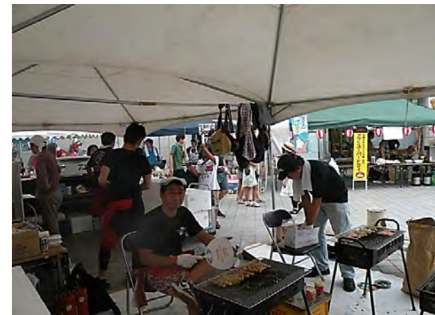
火加減を調整している青年部員