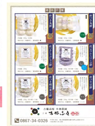
吉備高原 小林農園