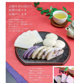
吉備高原 小林農園