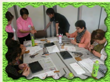
吉備中央町に備前ブロックの女性部員さん達をお招きして交流を図りました。 イノシシの革を使ってクラフトに挑戦して頂きました。