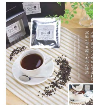
イージー株式会社