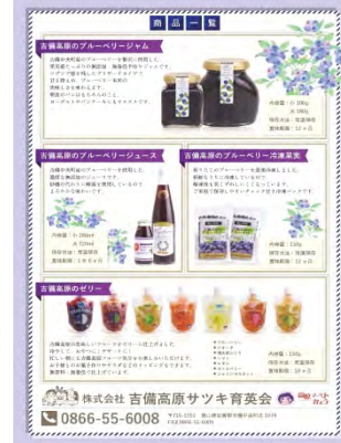
株式会社 吉備高原サツキ育英会